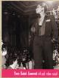
Yves Saint Laurent of the 60s