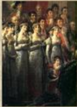
في بداية هذا العصر : قصة empire نساء الحاشية